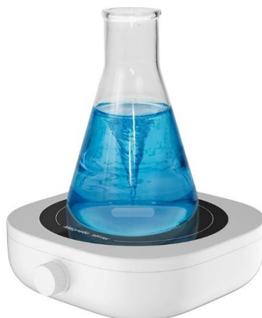
Rys. nr1 Zasada działania mieszadła SAMUDRA Magnetic Stitter .

Urządzenie wykorzystuje w swoim działaniu zasadę magnetyzmu (przepychanie się biegunów magnesów). W obudowie urządzenia, pod płytą na której stawiamy butelkę z płynem, umieszczony jest wirujący element magnetyczny. W butelce z płynem umieszcza się magnes mieszający „pastylkę magnetyczną”, siły przyciągania i odpychania wprawiają w ruch magnes mieszający umieszczony w butelce doprowadzając do wymieszania płynu.